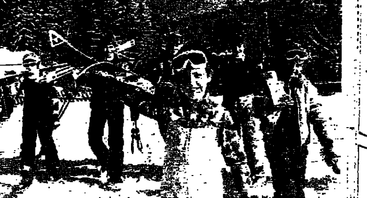
توجد الشبيبة في بلغاريا بإمكانات موضوعية واسعة للاستفادة من اوقات الفراغ إذ ان منظمهم - اتحاد شبيبة ديمتروف الشيوعية - توفر لهم قاعدة جيدة للحياة الثقافية: ١٤١ ناديا للثقافة والفن و ٩٥٣ ناديا للشباب تنتشر في سائر أنحاء البلاد وتضم ٤ ملايين و ٥٣١ حلقه وشعبة علمية وغيرها من الاسماء والتدوات وفقا للرقعة والهواية. وتوجد في بلغاريا شبكة من نادى الابداع الثقافي والعلمي للشبيبة (٦ الاف و ١٨٧ ناديا ينتمي الى عضويتها ما مجموعه مليون و ٩٠٢ الفا و ٦٤ عضوا) وكذلك ٥٣١ ناديا وحلقة علمية للشبيبة.

تتبع نتائج الدراسات الاجتماعية ان الشباب هم القاطن: التعلّم مع القيم والفعاليات الثقافية: إذ يرتد ٧٥% من الدارسين دور المسرح بالانتماء كما أنهم يشكلون انشط قراء الروايات والفن الابدية. ويؤيد الشباب في سن ١٤-١٥ سنة نسبة ٦٤% بلقطة من زلازل السينما المواقفين (يرتد تصفهم